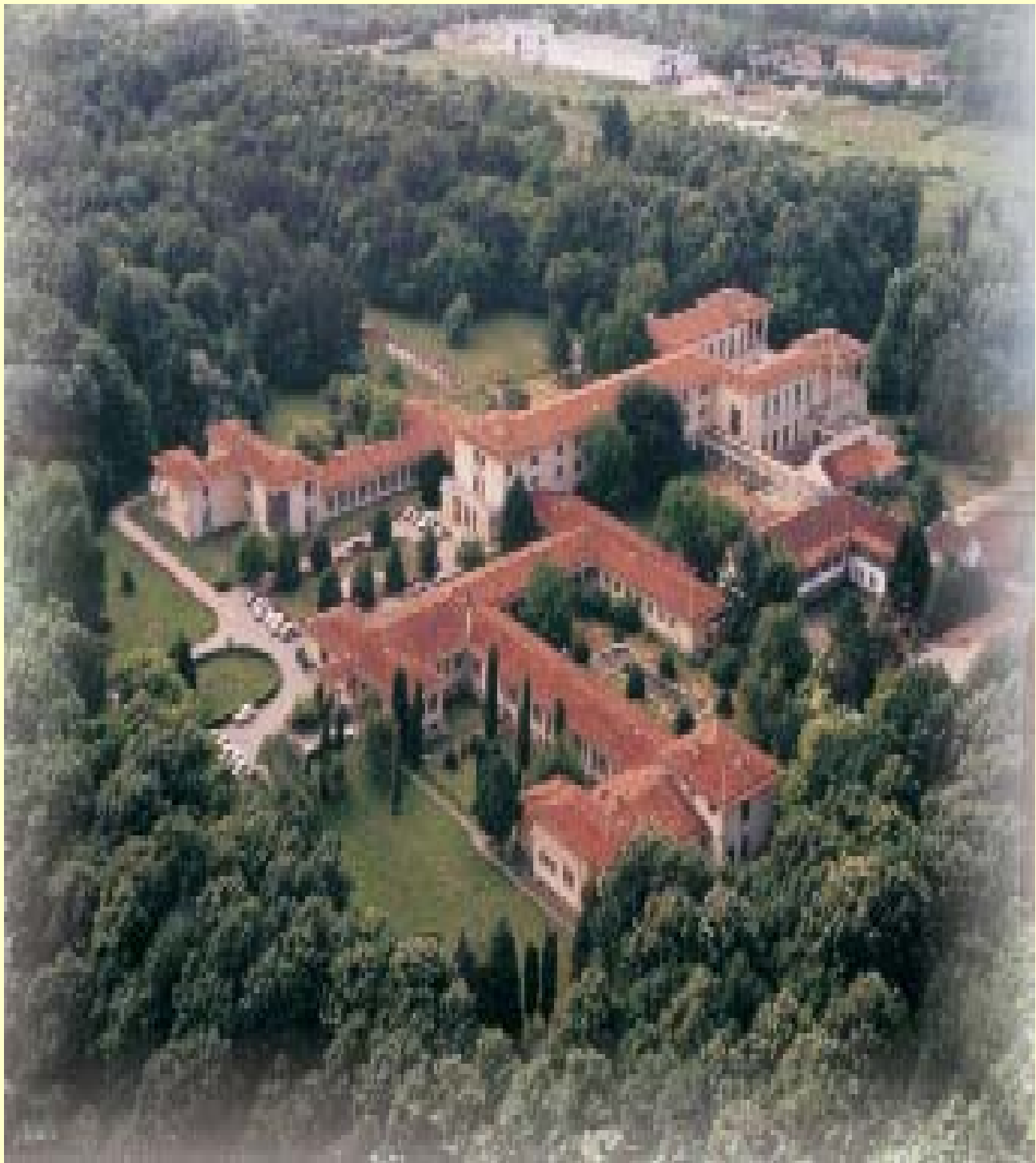
Institutul Național de Gerontologie și Geriatrie "Ana Aslan" Sediul OTOPENI Soseaua Bucuresti-Ploiesti, nr. 307, Otopeni, www.ana-aslan.ro